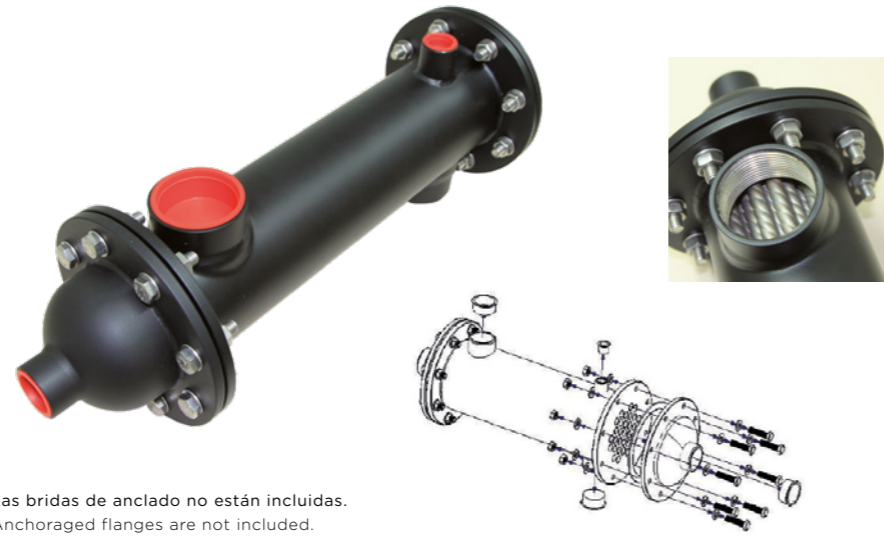
Las bridas de anclaje no están incluidas. Anchored flanges are not included. Brides ancrés ne sont pas inclus.

D'un autre côté, cette gamme permet la possibilité d'ajouter un capteur de température.