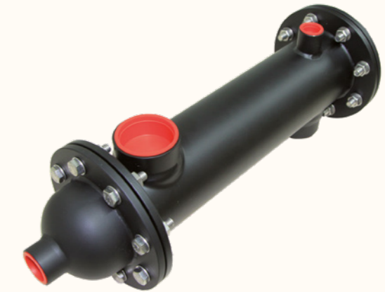
INTERCAMBIADORES DE CALOR HEAT EXCHANGERS Info pág. | Info page 64

PISCINA PÚBLICA | PRIVADA PUBLIC | PRIVATE POOL